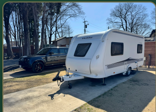
開発者自身の ヘッド+連結12m トレーラー